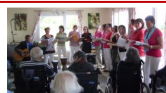
La chorale au foyer logement